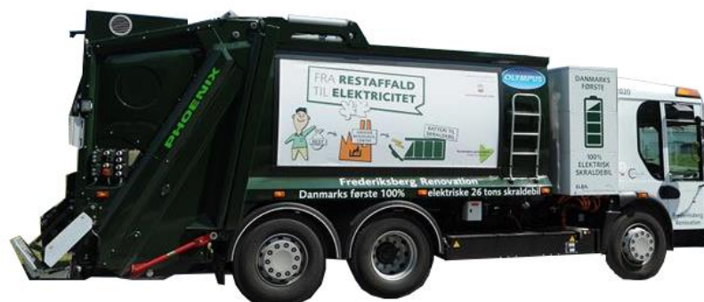
Figur 3-2 Elektrisk renovationsbil.

Støjniveauet fra en eldrevne renovationsbil er målt til ca. 65 dB, dvs. væsentligt lavere end for dieslbiler. Samtidig er der ingen lokal luftforurening fra eldrevne biler. Disse to faktorer medfører et forbedret arbejdsmiljø for renovationsmedarbejderne.